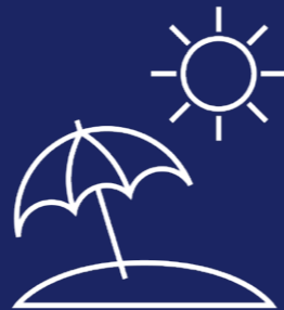
30 Tage Urlaub