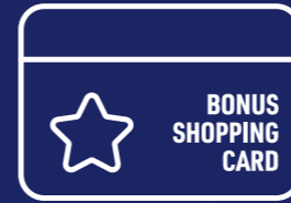
Bonus Shopping Card